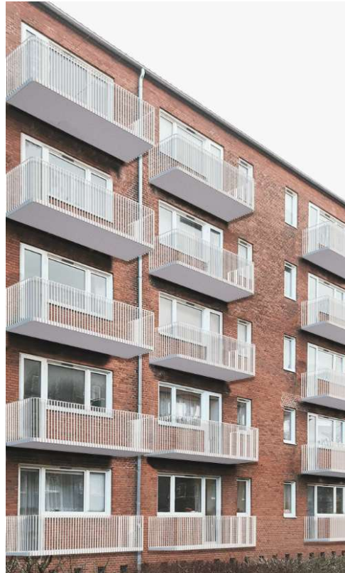
Altantype 3 Blok B og C