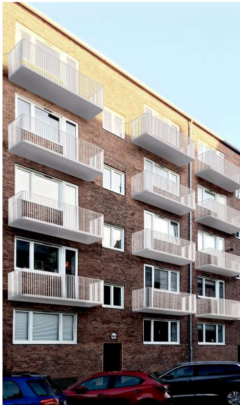
Altantype 2 Blok A mod Bremensgade

Nedenstående visualiseringer er udelukkende gældende for altaner. For vinduer og døre se vinduesoversigt.